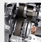
СВЪРЗАН С ДВИГАТЕЛЯ СЪЕДИНИТЕЛ

Вече в няколко поколения хибридни автомобили прогресивни технологии от HONDA се грижат за все по-добро представяне на батериите. Батериите на HONDA могат да съхраняват повече електричество при ниски загуби при заряд и разряд. Това дава възможност автомобилът да бъде експлоатиран при по-чести спирания на двигателя.