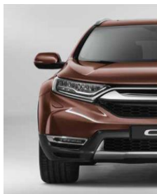
PREMIUM AGATE BROWN PEARL