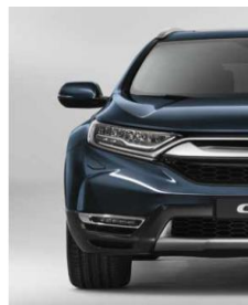
COSMIC BLUE METALLIC