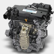
2,0 VTEC® ДВИГАТЕЛ ПО ЦИКЪЛА НА АТКИНСЪН

За да се ускорява добре един истински SUV са нужни мощни, но компактни мотори. Електрическото задвижване се състои от един генератор и един задвижващ електромотор. Генераторът произвежда електричество, което задвижва електромотора.